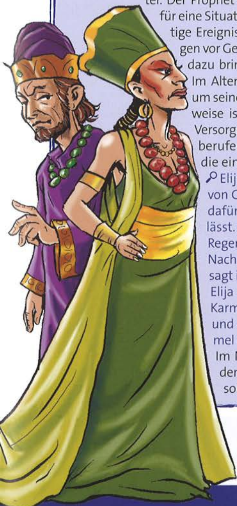
König Ahab und Königin Isebel