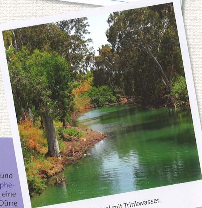
Der Jordan versorgt Israel mit Trinkwasser.