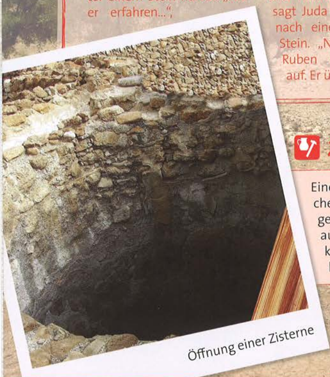
Öffnung einer Zisterne

Denkst du, dass die Brüder ihre Tat irgendwann bereuen?