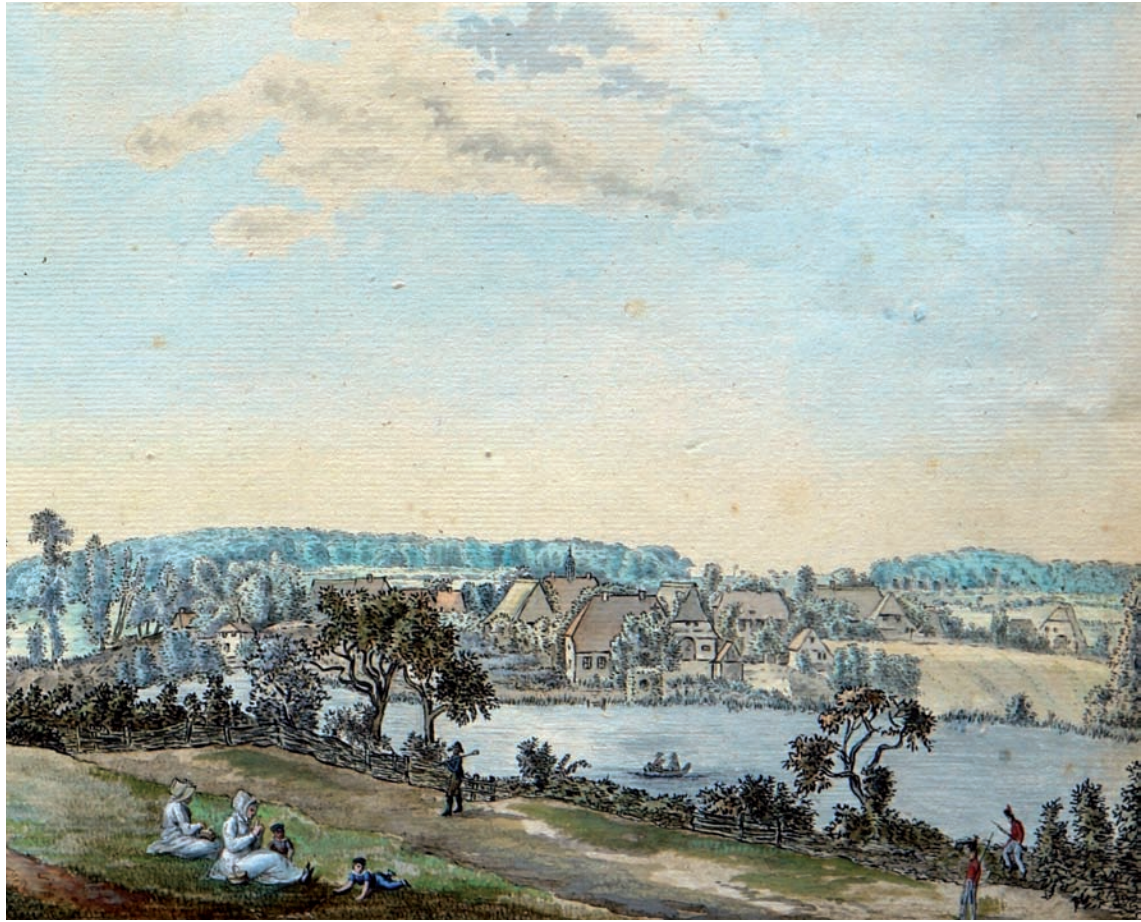
5 Claudius benannten Kirche).